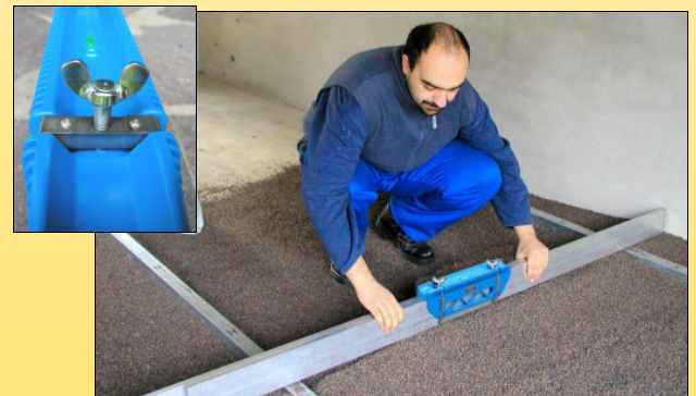
Diese neue Erfindung ist ideal zum Abziehen der Ausgleichsschüttung im Trockenbau...

Durch die neue Formgebung des Verbindungsteiles, werden die Latten äußerst fest miteinander verbunden. Sogar bei der enormen Arbeitsbreite von 4 Metern ist eine stabile Verbindung sichergestellt. Das Universal – Verbindungsteil ist aus äußerst schlagfestem Spezialkunststoff gefertigt. Breite: ca. 350 mm, Gewicht: 0,5 kg.