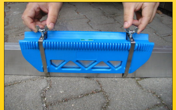
In Sekundenschnelle lassen sich die Latten festspannen und zum Verstellen wieder lösen.